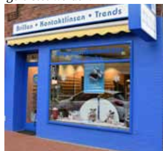
„Optik Tittel“ in der Hollerstraße 29.

Arbeiten am Webstuhl und sonstige handwerkliche Tätigkeiten im Nahbereich wären wieder möglich. Mit diesen Arbeiten könne wieder ein Beitrag zum Lebensunterhalt der Familien geleistet werden.