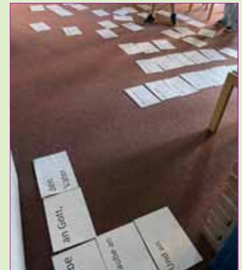
Ganz schön knifflig: Konfirmand*innen beim Glaubensbekenntnis-Puzzle.

Die Konfirmation – ein großes Fest für diese Jugendlichen und ihre Familien! Ein Fest, dass es so im Leben nur einmal gibt. Wir wünschen diesen Konfirmandinnen und Konfirmanden, dass gelingen mag, was sie sich vornehmen und Gottes Segen bei ihnen sein wird!