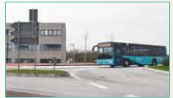
Ab dem 24. April sollen Busse die Haltestelle „Neuer Wall“ am Ärztezentrum anfahren.

vor dem Hotel „Heidehof“ und am Ärztezentrum sind fertig gestellt. Ab dem 24. April sollen dort Busse der Linien 700,