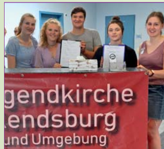
Die Jugendkirche auf dem Kirchentag. Hier der Empfangstresen zum Parcours „Spiritual Gym“.