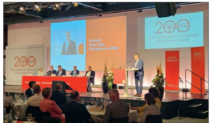
Hauptversammlung der Sparkasse Mittelholstein AG in der ACO Thormannhalle.

im letzten Jahr fast 200.000 Euro zur Verfügung gestellt. Als Einzelmaßnahmen im laufenden Jubiläumsjahr ragen dabei 10.000 Euro von STIKUM (Stiftung für Klima- und Um-