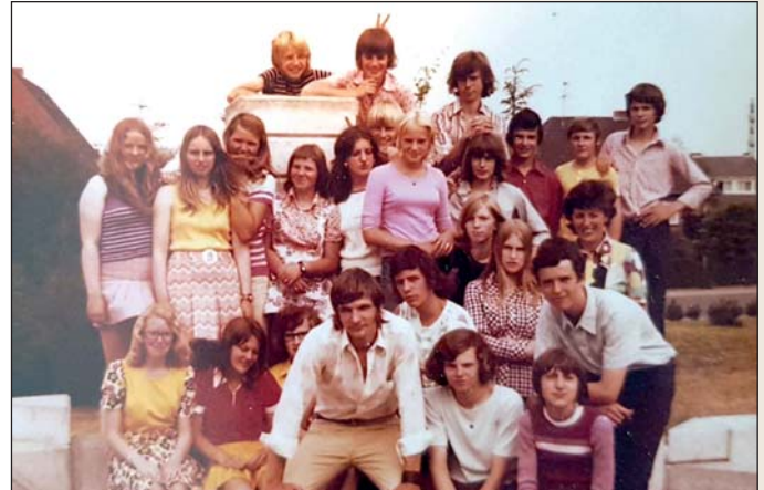
50 Jahre liegen zwischen den beiden Bildern.

den 50 Jahren zwischen Schulentlassung und Klassentreffen berichtet. Es war ein schöner Tag und ein nächstes Klassentreffen der 9a wurde ins Auge gefasst.“