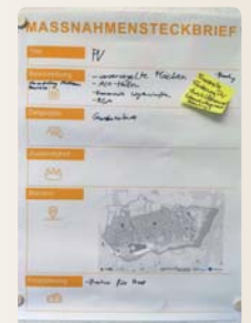
Maßnahmensteckbrief zum Thema Photovoltaik