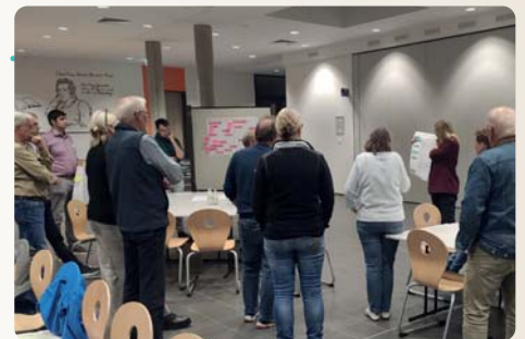
Präsentation der Diskussionsergebnisse

Die Teilnehmenden konnten innerhalb von zwei Runden an zwei unterschiedlichen Thementischen ihre Ideen teilen, diskutieren und konkrete Maßnahmen entwickeln. Am Ende der Veranstaltung wurden die Ergebnisse der Thementische im Plenum von den begleitenden Büros und den anwesenden Mitarbeitenden der Verwaltung vorgestellt.