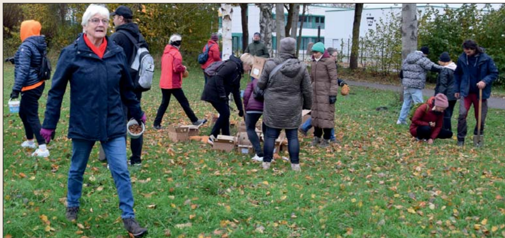
Rund 30 freiwillige Helfer waren bei der Pflanzaktion im Einsatz.

Mit diesen Aktionen wollen die beteiligten Organisationen auch grundsätzlich ein Zeichen setzen für mehr Natur in Parks, Gärten sowie auch auf Verkehrsbegleitflächen und hoffen auf viele Naturliebhaber, die sich von dieser Aktion anregen lassen. „Helfen Sie mit und lassen Sie uns gemeinsam aus öffentlichem Grün noch mehr öffentliches Bunt machen“, wünschte sich Dieter Neumann in seinem Aufruf.