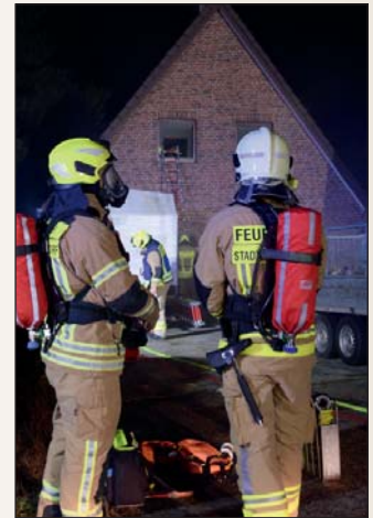
Bei der Jahresabschlussübung der Büdelsdorfer Feuerwehr wurden vier Personen aus einem brennenden Haus gerettet.

Krämer berichtete, dass die Wehr in diesem Jahr Zuwachs durch vier neue Kameraden bekommen habe. Damit konnte der Stand von 66 Aktiven gehalten werden.