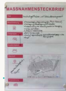
Maßnahmensteckbrief zum Thema Nachhaltiges Flächen- und Gebäudemanagement