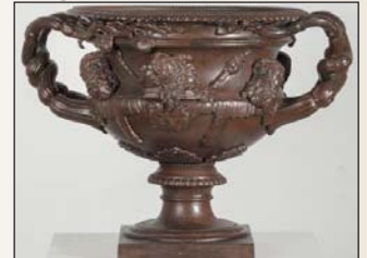
Warwick-Krater aus Gusseisen

deskreis Eintritt frei. Anmeldung siehe unten. „Wilder Tau-