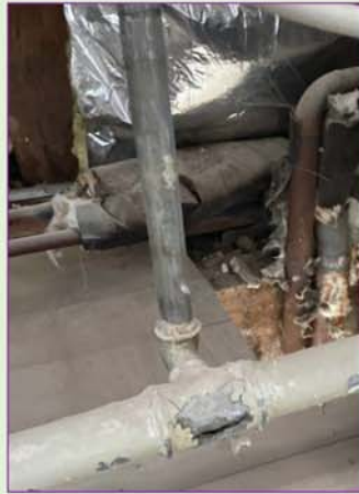
Der „Übeltäter“: Ein Rohrbruch im oberen Stockwerk des Gemeindehauses.

Im Dezember 2022 entstand im Gemeindehaus in der Kirchenstraße (ehemaliges eFa: Ev. Familienhaus) und in der Kreuzkirche ein Wasserschaden durch einen Wasserrohrbruch im oberen Stockwerk. Das Wasser lief durch