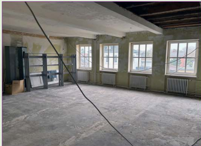
Der ehemalige Gemeindesaal: Aktuell trocken und entkernt.

Mittlerweile ist der versicherungsrechtliche Teil geklärt und der Kirchengemeinderat steht vor der großen Aufgabe, über die weitere Verwendung des Gebäudes zu beschließen. Da das Gemeindehaus die Kreuzkirche überbaut, lassen sich die Gebäudeteile nicht voneinander trennen, so dass wir über den gesamten Komplex entscheiden müssen. Die Versicherung deckt nur die Beseitigung des Wasserschadens ab, nicht aber die bei einer Sanierung anfallenden zusätzlichen Kosten. Eine Sanierung übersteigt aber die finanziellen Möglichkeiten der Kirchengemeinde. Deshalb müssen wir uns von Kreuzkirche und Gemeindehaus in der Kirchenstraße trennen. Denn gleichzeitig benötigt auch das Gemeindezentrum in der Berliner Straße eine grundlegende Sanierung.