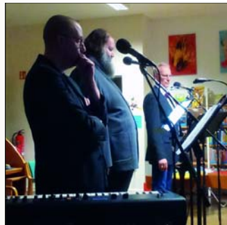
Die „Drei Herren“ in der Stadtbücherei.

bruchstellengeräts bis zum Nudelsieb kam so einiges zum Einsatz. Am Ende gibt tosenden Beifall für einen sehr gelungenen Abend. Hörspiele sind halt nicht nur etwas für Kinder.