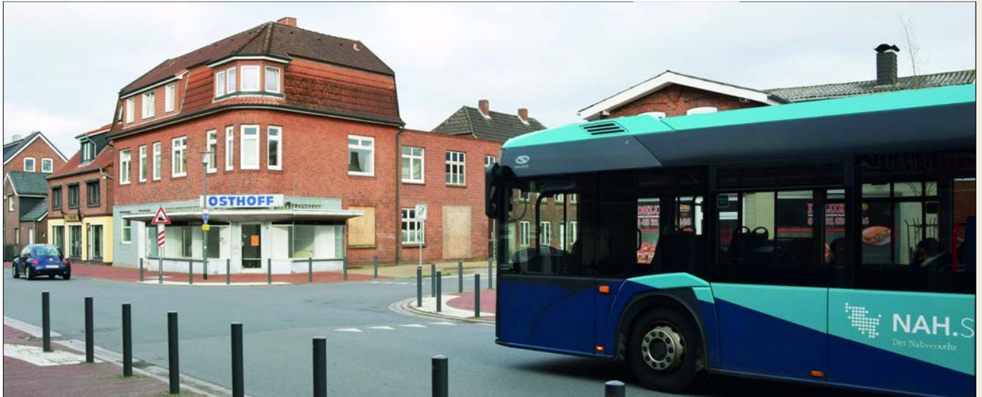
Fahrzeuge auf der Hollerstraße-West haben jetzt Vorfahrt gegenüber Fahrzeugen, die aus der Neuen Dorfstraße kommen.