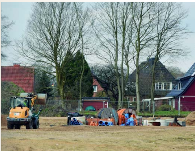
Die Erschließungsarbeiten für das Neubauprojekt laufen zurzeit.

Im Anschluss erfolgt abschnittsweise die weitere bauliche Entwicklung des Gebiets. Hier sollen sukzessive weitere 120 Wohneinheit im Segment des frei finanzierten Wohnungsbaus entstehen. Für die weiteren Gebäude entlang der Wollinstraße (2. Bauabschnitt) beziehungsweise Agnes-Miegel-Straße (5. Bauabschnitt) ist eine gemischte Nutzung aus Wohnen und Gewerbe angedacht.