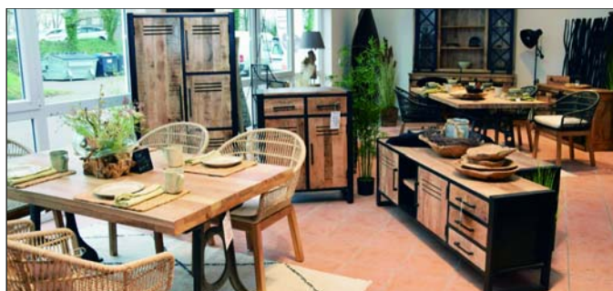
Möbel und Deko, individuell und nachhaltig.