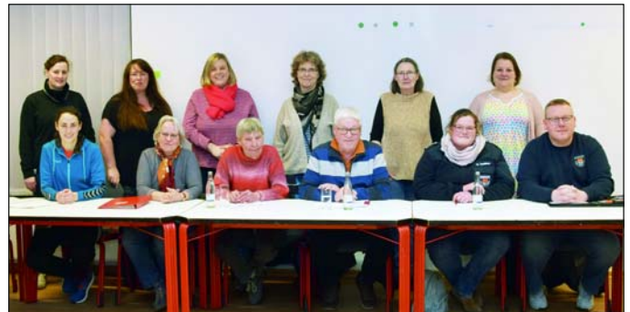
Das Veranstaltungskomitee bereitet den Ehrenamtstag vor.

und passende Angebote für Hilfwillige anzubieten.