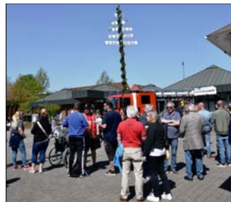
Gespräche unterm Maibaum.

Feuerwehrkameraden erklärten die verschiedenen Funktionen der Geräte auf ihren Fahrzeugen. Zu-