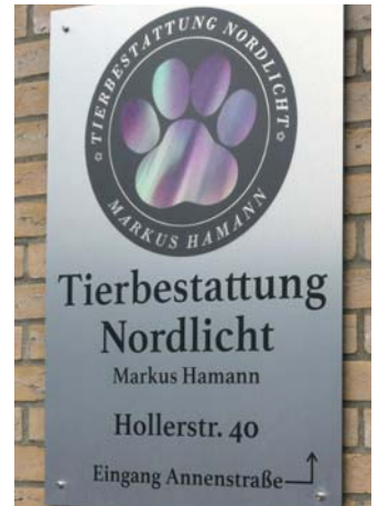
Die „Tierbestattung Nordlicht - Markus Hamann“ liegt in der Hollerstraße 40 / Ecke Annenstraße.