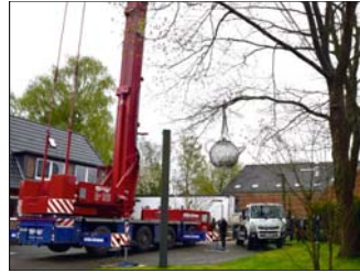
Mit einem Mobilkran wurde die 380 Kilogramm schwere eiserne Teekanne an ihren Standort gebracht.