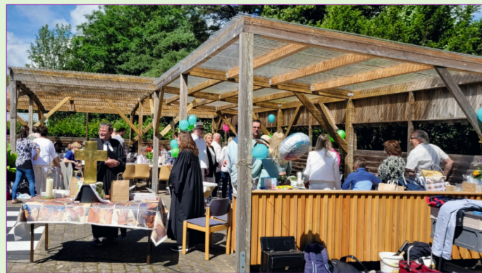
Sechs Familien an Tischen im Gottesdienst

ligten zu einem bleibenden Erlebnis. Im Anschluss feierten die Familien an ihren Tischen und nutz-