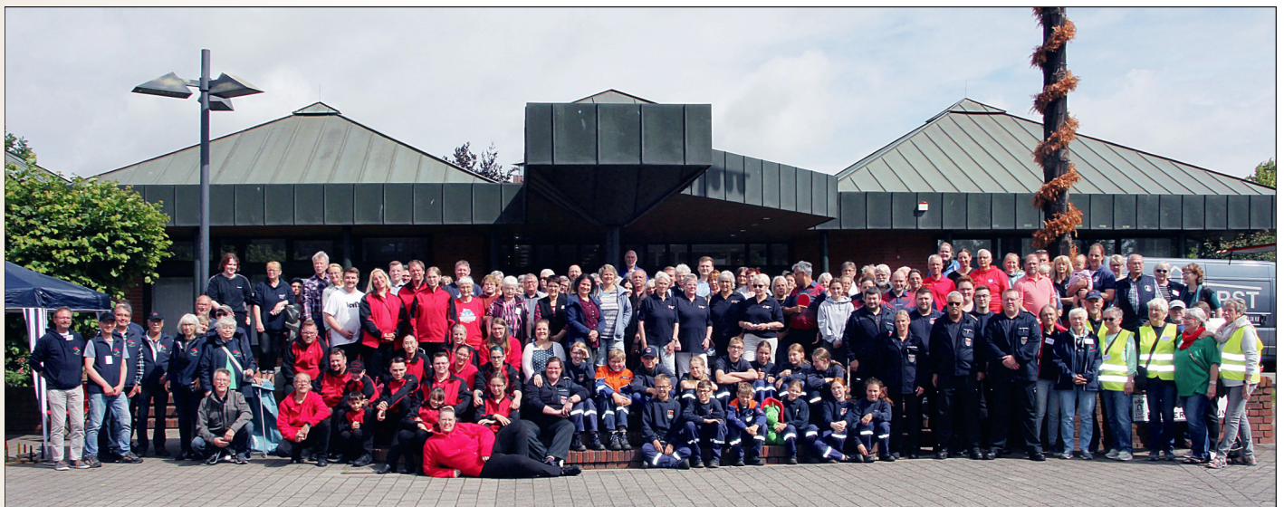
Ehrenamtstag: Gruppenbild der teilnehmenden Vereine