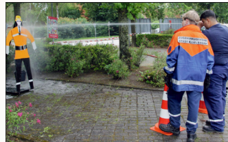
Mitglieder der Jugendfeuerwehr bei einer Vorführung