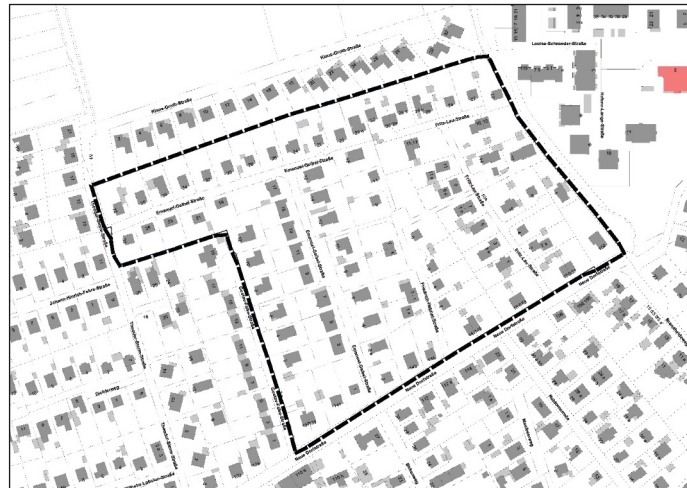
Übersichtskarte: Entwurf des Bebauungsplans Nr. 61

eingestellt und über den Digitalen Atlas Nord des Landes Schleswig-Holstein zugänglich. Zusätzlich liegen der Inhalt dieser Bekanntmachung und die nach § 3 Abs. 2 S. 1 BauGB auszulegenden Unterlagen im Rathaus der Stadt Büdelsdorf, Am Markt 1, 24782 Büdelsdorf, während folgender Zeiten öffentlich aus: