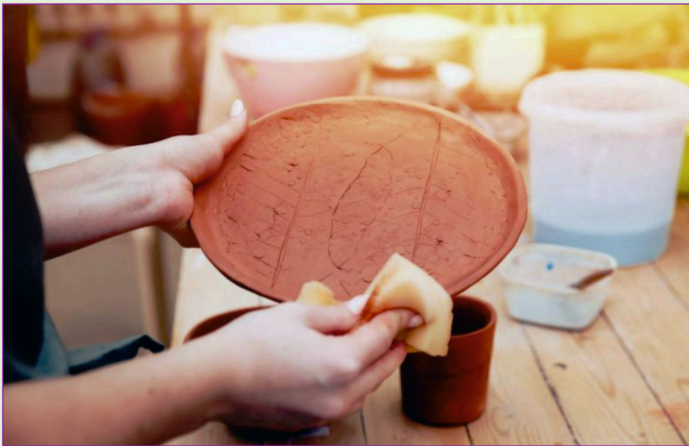
Einfach was machen mit Ton.