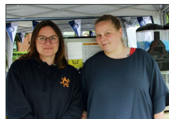
Die Damen vom Förderverein der Astrid-Lindgren-Schule und vom BTSV sorgen für Erfrischungen.

Mit großem Interesse wurden die einzelnen Stände im und am Bürgerzentrum besucht, viele Gespräche geführt und sich mit Informationen versorgt.