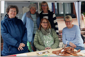
Die Damen der Spielothek präsentieren ihre Spiele.

Jahren Verantwortung für eine Jugendgruppe übernehmen dürfe, aber nicht wisse, was zu tun sei. Im BTSV – wie auch an anderer Stelle - bemühe man sich, Kinder und Jugendliche schon früh einzubinden, und es sei toll zu sehen, wie sich diese entwickeln.