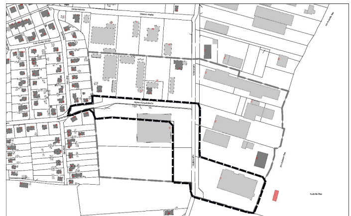
Übersichtskarte: Entwurf der 1. Änderung des Bebauungsplans Nr. 60

Montag bis Freitag 08.00 bis 12.00 Uhr und Donnerstag 15.00 bis 17.30 Uhr. Der genaue Plangeltungsbereich ist der Übersichtskarte zu entnehmen und durch die schwarze Umstrichelung gekennzeichnet.