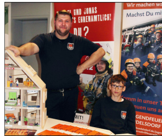
Werbung für die Freiwillige Feuerwehr und die Jugendfeuerwehr

Hauptamtliche Angebote können eine gute Unterstützung für das Ehrenamt sein, wenn sie flexibel seien und das Ehrenamt verstehen würden.