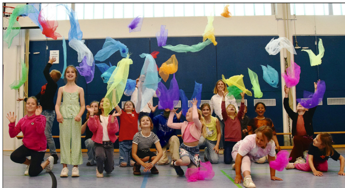
Mit bunten Tüchern tanzten die Kinder bei der Aktion „Ich steh auf für Demokratie.“

Und weil all dies Demokratie ist - und Demokratie so wichtig ist für uns, unsere Schule, für das Zusammenleben, trafen wir uns am Donnerstag, 6. Juni, in der Turnhalle und setzten alle zusammen ein klares und deutliches Zeichen für dieses Miteinander: Wir standen für die Demokratie und für das Miteinander auf und machten uns für sie groß.“