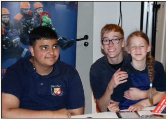
Mitglieder der Jugendfeuerwehr